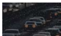
CCD de empresas concorrentes

A compensação dinâmica de defeitos do CCD é outra tecnologia inovadora da SAMSUNG Electronics que reduz o ruído de fundo.